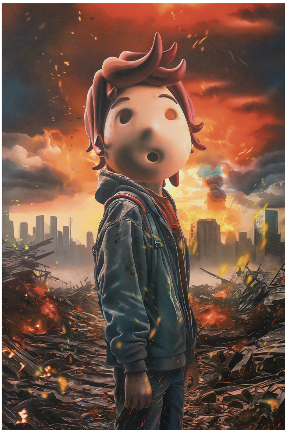
"Lost Paradise" Acrylic on canvas, 150 x 100 cm 2025

In collaboration with Maddox Gallery - London.