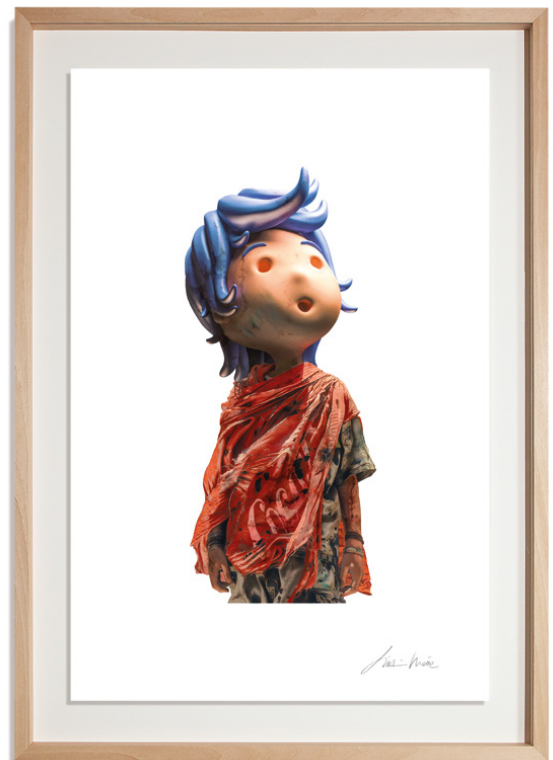
High-definition Giclée print on 310gsm Archer paper, float mounted, handcrafted limewood frame, 50 x 70 cm