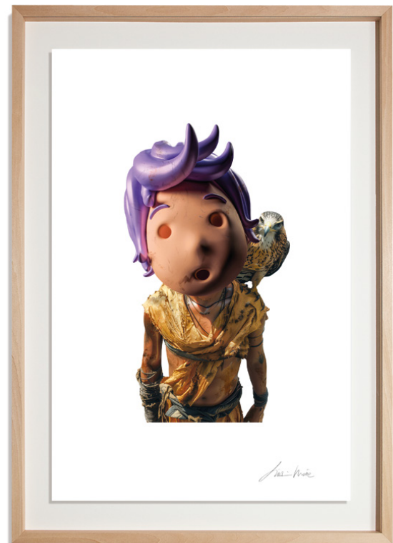
High-definition Giclée print on 310gsm Archer paper, float mounted, handcrafted limewood frame, 50 x 70 cm