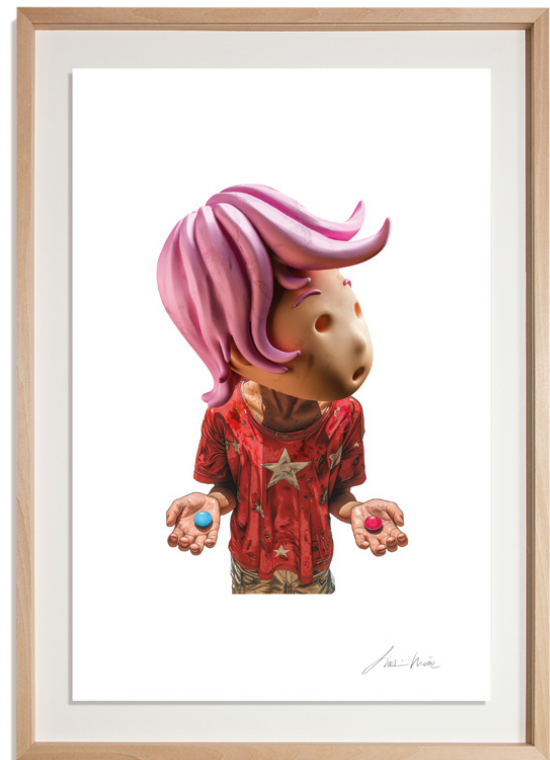
High-definition Giclée print on 310gsm Archer paper, float mounted, handcrafted limewood frame, 50 x 70 cm