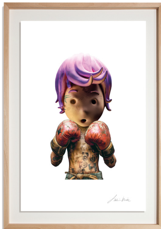
High-definition Giclée print on 310gsm Archer paper, float mounted, handcrafted limewood frame, 50 x 70 cm