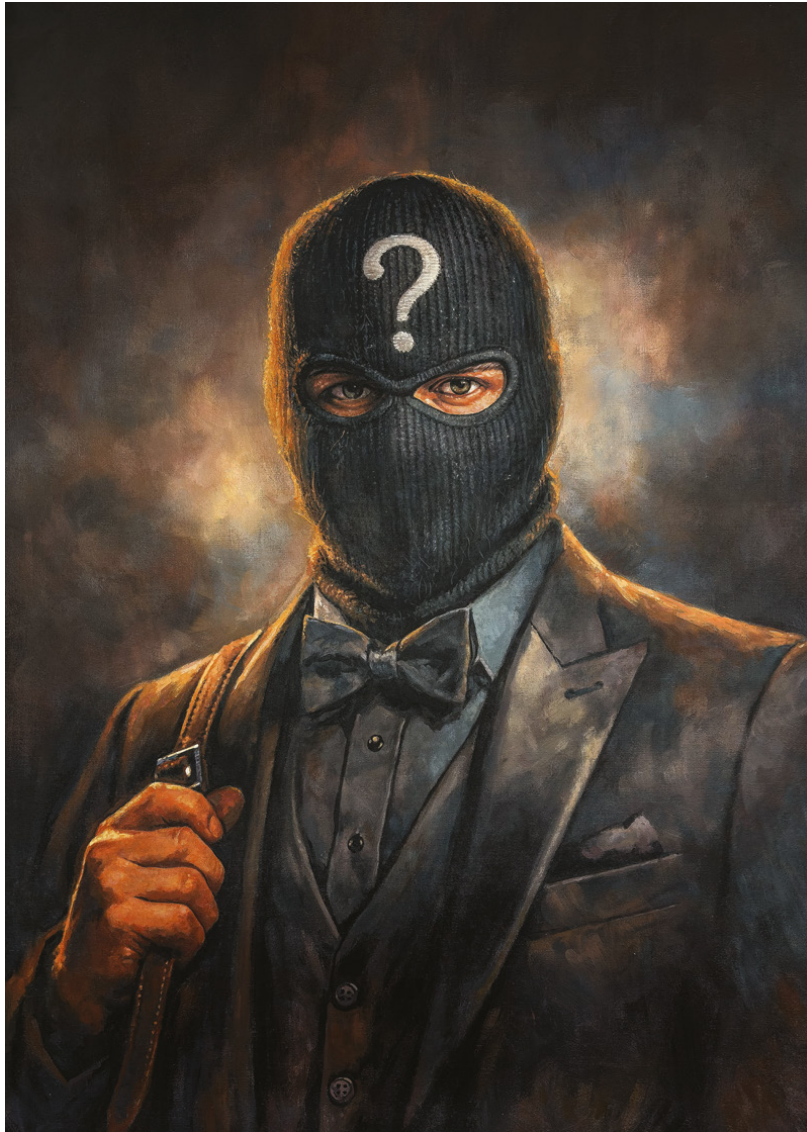
"Question Mark" Acrilico su tela, 40 x 60 cm 2025